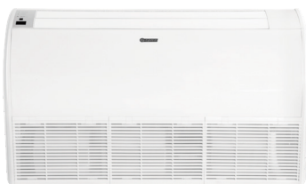
Sivulta puhaltava sisäyksikkö 70-A

GREEN kehittynyt invertteriteknikka mahdollistaa hyvän energiatehokkuuden. Nyt ympäristöystävällisellä R32 kylmäaineella.