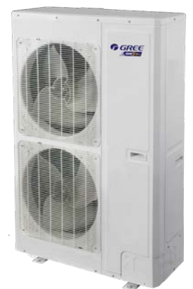
GMV-160 Mini VRF

Sisäyksikkömalleja on useita erilaisia ja eri tehoisia. Laajasta sisäyksikkömallistosta löytyy seinälle asennettavat mallit ja kattokasetit – aina tarpeen mukaan. Erikokoisiin tiloihin on saatavilla tietenkin eri tehoisia sisäyksiköitä. Sisäyksiköt ovat tyylikkäitä ja huomaamattomia ja myös erittäin hiljaisia. Kutakin sisäyksikköä ohjataan omalla kaukosäätimellä. Lisäoptiona myös langallinen kaukosäädin. Lisäoptiona myös langallinen kaukosäädin.