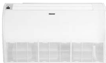
Sivulta puhaltava sisäyksikkö 70-A